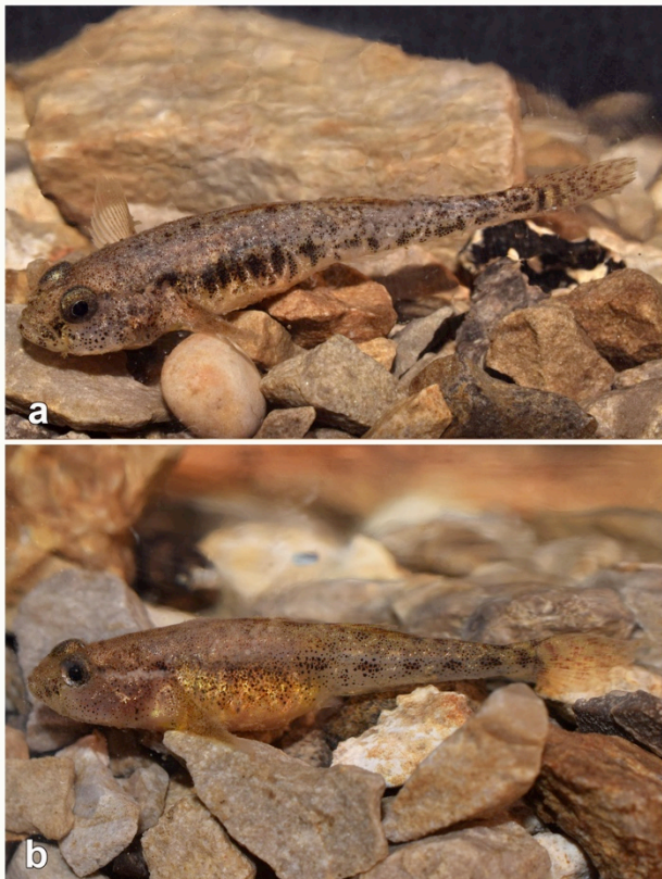
Fig. 3 Living specimen of the species Orsinigobius punctatissimus from Stagni di Sablici (Doberdò del Lago, Gorizia province, Friuli-Venezia Giulia): a) MZUF 17640, b) MZUF 17641.

covered by abundant aquatic macrophytic vegetation. The specimens were collected at a depth of 40cm. A mixed deciduous forest was present around the spring. The geological substrate was formed by skeletal limestone of neritic and carbonate platform facies from the Upper Cretaceous. The various small streams that originate from this and similar springs in the area flow into the Moschenizza River, which then flows into the Locavaz Channel; the latter then joins the Timavo River, which flows into the Panzano Gulf (northern Adriatic Sea). The area of the mentioned springs is included between the route of the A4 Torino-Trieste motorway and the north-eastern suburb of Monfalcone. The territory is part of the Special Area of Conservation (SAC) “IT3340006 Carso Triestino e Goriziano”.