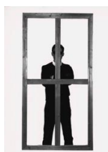
Fig. 6. Giulio Paolini, Delfo , 1965, fotografia su tela emulsionata, 180 x 95 cm, Walker Art Center, Minneapolis, Gift of the T. B. Walker Foundation by exchange, 2003, © Giulio Paolini. Cliccare qui per un'immagine a più alta risoluzione.