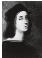
Fig. 10. Giulio Paolini, L'invenzione di Ingres , 1968, fotografia su tela emulsionata, 42 x 32 cm, Pinault Collection. © Giulio Paolini, foto Mario Sarotto. Courtesy Fondazione Anna e Giulio Paolini, Torino. Cliccare qui per un'immagine a più alta risoluzione.

deontologica e, dunque, solo per tale virtù, trascendentale in un senso latamente kantiano: un io capace di uno sforzo metacognitivo e appercettivo che superi i propri condizionamenti culturali e biopolitici. Soltanto grazie a questa astrazione, al riconoscersi in una figura metastorica, era possibile accogliere in essa, sovrapponendole, identità multiple ed eterogenee (Ingres, Raffaello, Saffo, Borges, Paolini, ecc.). Una riprova di questa posizione sta nel fatto che Paolini non operò mai sul registro delle fonti che prelevava; cioè, non ricorse mai alla caricatura, al pastiche , alla parodia: l'identità dell'io individuale, singolo, biografico non era in gioco in queste sostituzioni. Anzi, era la sua permutabilità la condizione precipua che, nel Novecento, l'autore scopriva di sé in quanto categoria, allo stesso tempo, storica nella sua fondazione e metastorica nella sua ambizione.