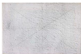
Fig. 2. Giulio Paolini, Un quadro , 1970, fotografia su tela emulsionata, 14 esemplari, 40 x 60 cm, varie ubicazioni © Giulio Paolini, foto Paolo Mussat Sartor. Courtesy Fondazione Anna e Giulio Paolini, Torino. Cliccare qui per un'immagine a più alta risoluzione.