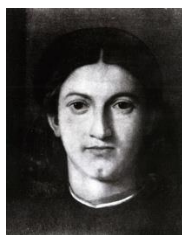
Fig. 3. Giulio Paolini, Giovane che guarda Lorenzo Lotto , 1967, fotografia su tela emulsionata, 30 x 24 cm, Sammlung FER. © Giulio Paolini. Courtesy Fondazione Anna e Giulio Paolini, Torino. Cliccare qui per un'immagine a più alta risoluzione.

Italo Calvino aveva colto in profondità il meccanismo implicito in queste immagini. Dalla prima aveva tratto l'idea di una potenzialità dell'opera come puro abbrivio, in quanto istituzione di una cornice—geometrica o narrativa che fosse—che si prestava ad una “ripetizione differente” pressoché infinita, convertendola nella serie di incipit , ossia di primi capitoli interrotti, di cui era costituito Se una notte d'inverno un viaggiatore . 15 Dalla seconda aveva mutuato la mise en abyme , intesa come espediente per evidenziare l'atto stesso della fruizione: l'immagine contenuta in un'altra immagine (o il libro contenuto in un altro libro) era funzionale a far emergere l'atto stesso dell'osservare, in Paolini, e quello della lettura, in Calvino. 16