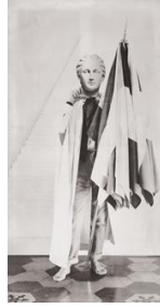
Fig. 9. Giulio Paolini, Delfo II , 1968, fotografia su tela emulsionata, 180 x 95 cm, Pinault Collection. Cliccare qui per un'immagine a più alta risoluzione.