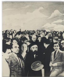
Fig. 8. Giulio Paolini, Autoritratto , 1968, fotografia su tela emulsionata, 151 x 126 cm, The Georges Economou Collection, Athens. © Giulio Paolini, foto Elisabeth Bernstein, Dominique Lévy Gallery, New York. Courtesy Fondazione Anna e Giulio Paolini, Torino. Cliccare qui per un'immagine a più alta risoluzione.

dedicherà altre opere; 53 e alle spalle, infine, era presente A J.L.B. (1965), una vertiginosa prospettiva di una scalinata, che omaggiava lo scrittore Jorge Luis Borges. 54 La molteplicità dei riferimenti lasciava intendere un'identità plurale e fluida, derivata dall'introiezione di disparati modelli storici: in Averroè , le quindici diverse bandiere, issate su un'unica asta, insinuavano i limiti a cui era soggetta l'unità dell'intelletto (celebre oggetto di studio del filosofo); Saffo , per parte sua, non poteva non richiamare un leggendario e sofisticato rifiuto dell'eteronormatività; e Borges, infine, suggeriva la paradossalità di tutti questi rispecchiamenti—aspetto su cui tornerò più avanti. Ricomposta con tale ibridazione, l'identità del Paolini artista non sembrava porsi confini pregiudiziali, attraversando culture, discipline, epoche, generi e orientamenti sessuali diversi. Ma, per altri versi, tale apertura era soggetta ad una sorta di epochè , di sospensione non tanto del giudizio quanto dell'immedesimazione empatica in un soggetto incarnato ed empirico. Una forma paradossale di distanziamento che l'artista riservò sempre verso le sue fonti, nonostante le implicazioni della sua opera: in Italia, per fare un controesempio, dai suoi mascheramenti storici avevano preso avvio le esplorazioni proto-queer di Luigi Ontani, e Paolini stesso fu assai vicino a Carla Lonzi, critica d'arte e intellettuale, fondatrice del femminismo radicale di Rivolta Femminile. 55