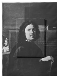
Fig. 7. Giulio Paolini, Autoritratto , 1968, fotografia su tela emulsionata, 98 x 74 cm, Collezione Baldassarre, Bari. © Giulio Paolini, foto Mario Sarotto. Courtesy Fondazione Anna e Giulio Paolini, Torino. Cliccare qui per un'immagine a più alta risoluzione.