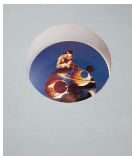
Fig. 13. Giulio Paolini, Belvedere , 1992, riproduzione fotografica su plexiglas, diametro 70 cm, opera non più esistente. Cliccare qui per un'immagine a più alta risoluzione.