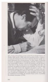
Fig. 12. La fotografia di Sebastião Salgado riprodotta in Album Calvino , a cura di Luca Baranelli ed Ernesto Ferrero (Milano: Arnoldo Mondadori Editore, 1995), n. 222, 260. Cliccare qui per un’immagine a più alta risoluzione.