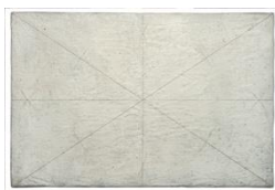
Fig. 1. Giulio Paolini, Disegno geometrico , 1960, tempera e inchiostro su tela, 40 x 60 cm, Fondazione Anna e Giulio Paolini, Torino © Giulio Paolini, foto Mario Sarotto. Courtesy Fondazione Anna e Giulio Paolini, Torino. Cliccare qui per un'immagine a più alta risoluzione.

nello spazio e nel tempo del punto occupato dall'autore (1505) e (ora) dall'osservatore di questo quadro.” 14