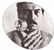
Fig. 11. Giulio Paolini, Alain Robbe-Grillet , 1967, fotografia su tela emulsionata, 35 x 45 cm, Collezione Verdun, Torino. © Giulio Paolini, foto Ernani Orcorte. Courtesy Fondazione Anna e Giulio Paolini, Torino. Cliccare qui per un'immagine a più alta risoluzione.

C'era dunque un elemento di paradossalità in queste duplicazioni che dimostra l'aporia della rappresentazione quale condizione perché essa possa infine avvenire (sovrapponendo,