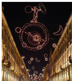
Fig. 14. Giulio Paolini, Palomar ; 1998, strutture di metallo, microlampadine racchiuse in tubi di plastica, cavi d'acciaio, dimensioni ambientali, Comune di Torino. © Giulio Paolini, foto Pino Falanga. Courtesy Fondazione Anna e Giulio Paolini, Torino. Cliccare qui per un'immagine a più alta risoluzione.