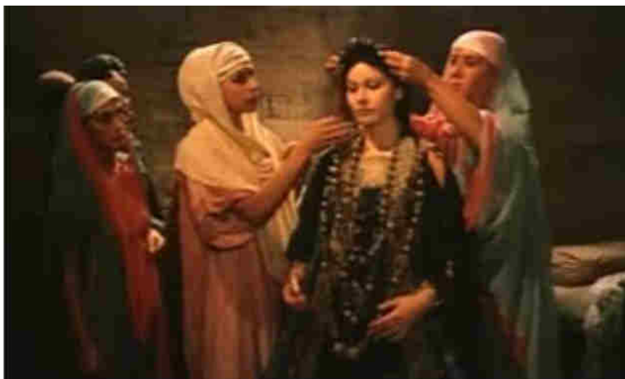
Figg. 17-19 I costumi Colchide (in alto) e quelli di Corinto (al centro). L'incompatibilità di questi due mondi è sottolineata anche dal dono di Medea a Glauce: l'abito tradizionale che provocherà la sua morte (in basso).