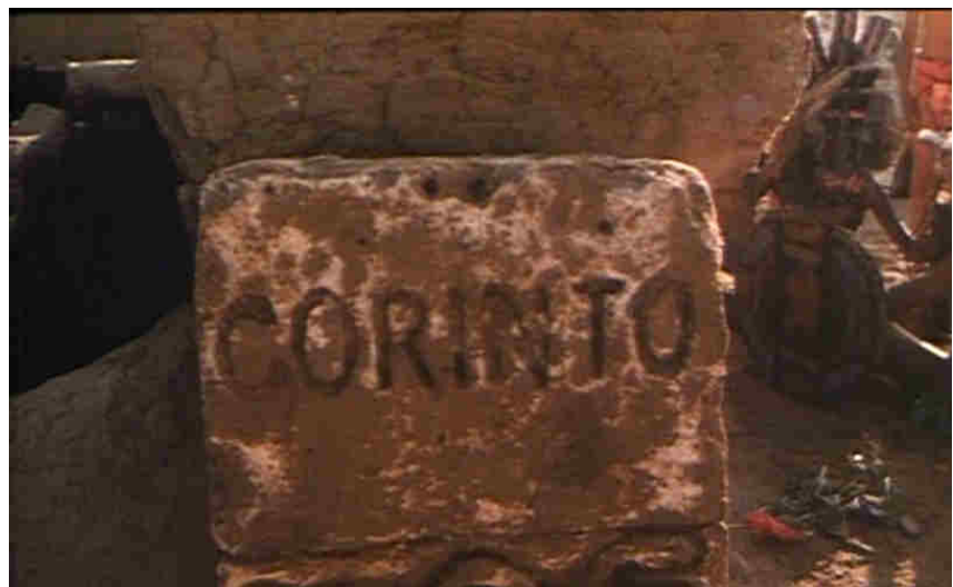
Figg. 8-10 Le pietre miliari che indicano Tebe e Corinto e il bivio di fronte al quale Edipo si ritrova dopo aver ascoltato il responso dell'oracolo.