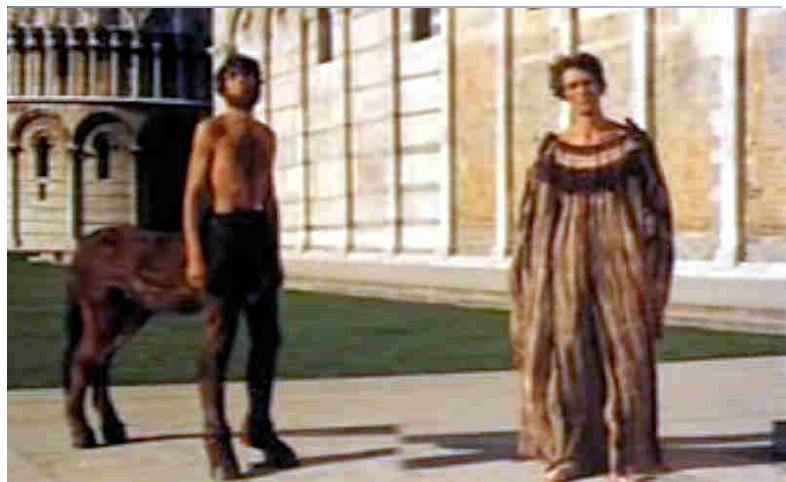
Figg. 14-16 (dall'alto) La Corinto dell'Edipo re , gli esterni della Corinto di Medea , girati ad Aleppo (Siria) e l'interno della città ambientato nella Piazza dei Miracoli di Pisa .