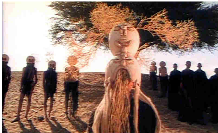
Figg. 11-13 Alcuni esempi dei costumi realizzati da Pietro Tosi: (dall'alto) Re Polibo, il Gran Sacerdote, l'oracolo.