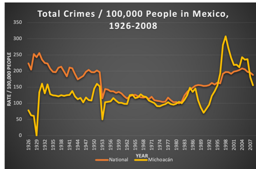
Figure 1. Total Crimes in Michoacán and México, 1926–2008. By author. Sources: Data from Piccato et al. (2017), Calderón et al. (2019), INEGI (2021).

Conventional explanations for violence in Michoacán consider the recent historical role of drug trafficking organizations (DTOs) and transnational criminal organizations (TCOs) (Beittel, 2020). In Michoacán, DTOs and TCOs are fluid in form and territorial scope and include the Knights Templar ( Caballeros Templarios ) and La Familia Michoacana ; the Sinaloa, Tijuana, Juárez/CFO, and Gulf Cartels; Los Zetas , Beltrán Leyva , and the Cartel Jalisco Nuevo Generación . Beittel (2020) argues that "Mexican... DTOs pose the greatest crime threat" in the Western