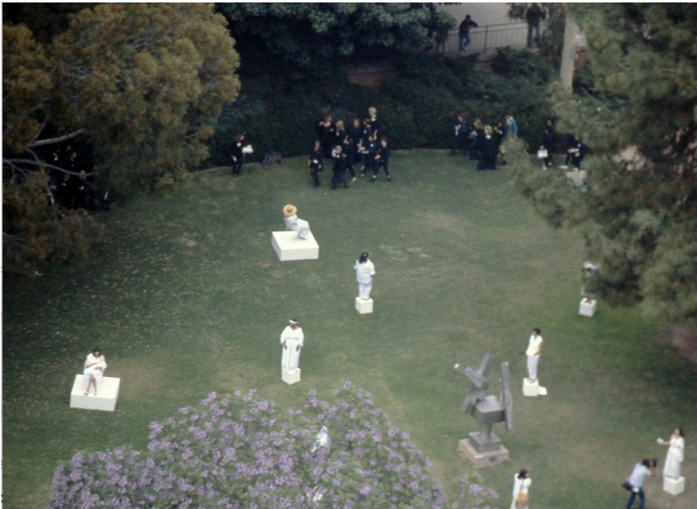
Suzanne Lacy, The Dark Madonna , 1985-86.

the Murphy Sculpture Garden. “The Dark Madonna” created a tableaux vivant with women of different races and walks of life. Lacy invited them to occupy the garden, some on pedestals alongside the sculptures. The performance engaged with critical issues of race, gender, and performance, layering the modernist sculptures with new meanings and political dimensions. Zebracki (2015) argues that