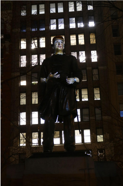
Krzysztof Wodiczko, Monument, 2020. Madison Square Park, New York. Digital color video, sound, 25 minutes.