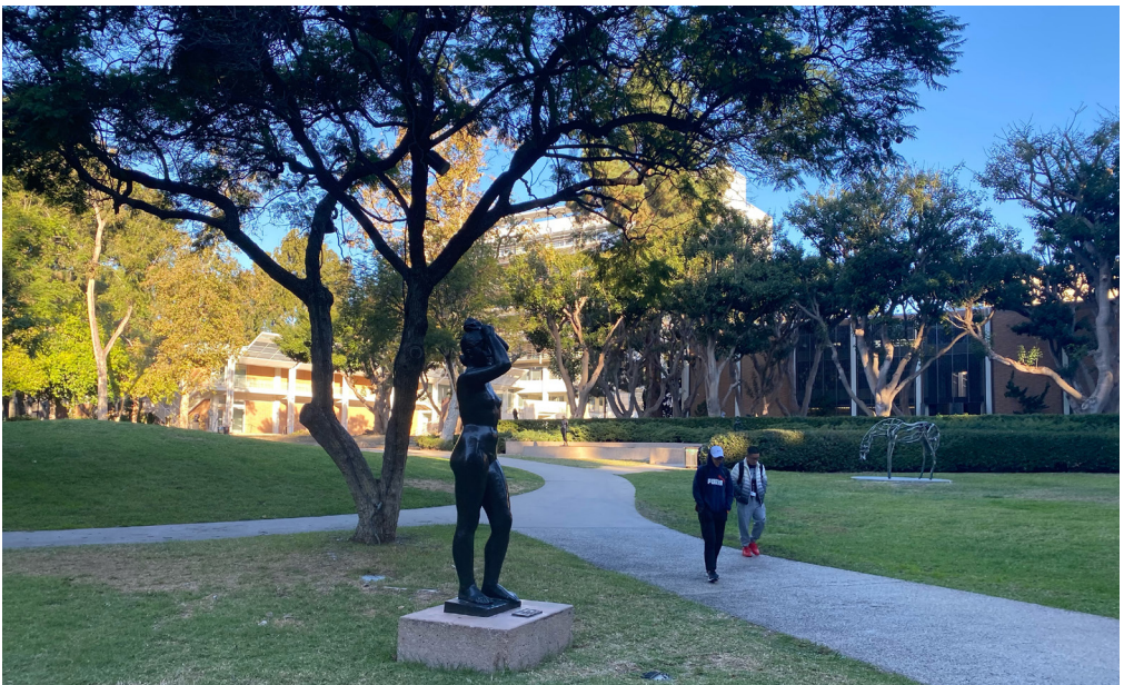
Gerhard Marcks, Maja, 1945. Gift of Mr. and Mrs. Jack Warner and the UCLA Art Council.