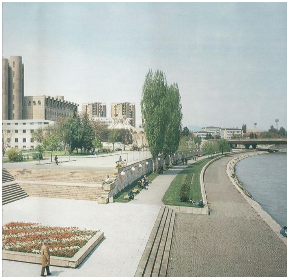
Figure 10. The open spaces along the banks of the river Vardar looking west from the Stone Bridge, circa 1970. The PTT telecommunications complex on the left, the towers from the City Wall peeking behind the main rotunda of the Post Office building, and the CK government building on the right.

Figura 10. Los espacios abiertos a lo largo de las orillas del río Vardar mirando hacia el oeste desde el Puente de Piedra, alrededor de 1970. El complejo de telecomunicaciones PTT a la izquierda, las torres de la muralla de la ciudad asomando detrás de la rotonda principal del edificio de Correos, y el edificio del gobierno de CK a la derecha.