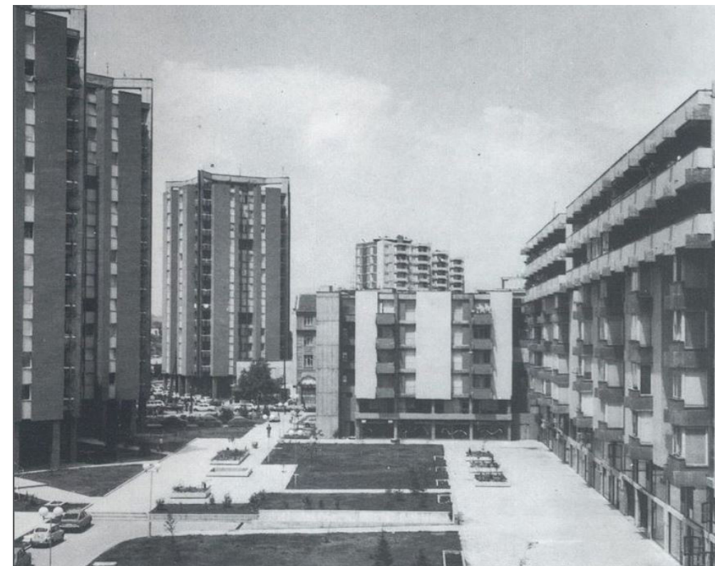
Figure 7. The open spaces (Plochnik = tiled area) behind residential buildings of the City Wall, an example of open space that incorporates greenery, playgrounds, walkways and passages.

El ocio fue una de las actividades cruciales definidas por Lefebvre que tiene el potencial de transformar las relaciones de capital existentes y producir nuevas relaciones con lo urbano. Sin embargo, era importante delimitar que el ocio ocurre por sí solo, "a menudo teniendo lugar en espacios vacíos: campos de nieve, playas" (Lefebvre 2014: 52). Esto es diferente de los espacios de ocio diseñados por la industria turística, que sólo refuerza su lugar en la reproducción social capitalista. Es por eso que el ocio y el disfrute necesitan "espacios calificados", apropiados o abiertos a la apropiación fuera de la lógica urbana dominante. La introducción de espacios abiertos "en circuitos y redes preexistentes (comerciales, financieras, industriales)" es un esfuerzo considerable