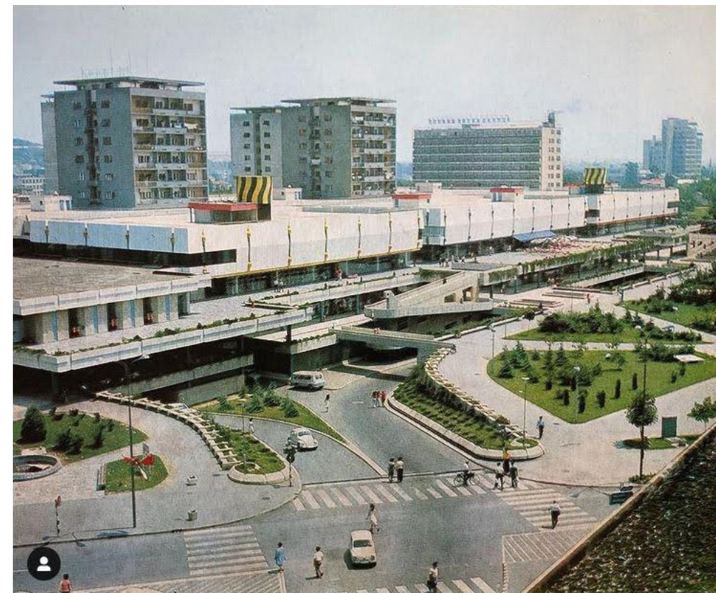
Figure 5. The open spaces, balconies, microgreenery around the GTC and Woman Warrior Park left.

En Architecture of Enjoyment , Lefebvre caracteriza los espacios abiertos como aquellos que son libres de apropiación, definidos "[en] contraste con la dominación y simultáneamente por oposición a la propiedad y sus consecuencias", y como tales se crean y existen fuera de la lógica urbana dominante. "El espacio apropiado no pertenece a un poder político, a una institución como tal" (Lefebvre 2014. 87-88; 52; 94). En la "Revolución Urbana", los espacios abiertos se mencionan como los jardines y parques que son "responsables de la calidad de vida" en las principales ciudades metropolitanas, como intentos de reunir "lo espontáneo y lo artificial, la naturaleza y la cultura" en un entorno urbano. (Lefebvre [1970] 2003.