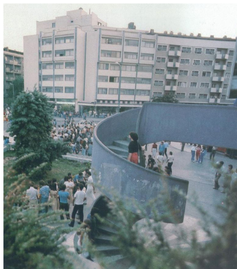
Figure 6. How popular the open spaces were in the years before privatization.

Figura 6. Qué populares eran los espacios abiertos en los años previos a la privatización.