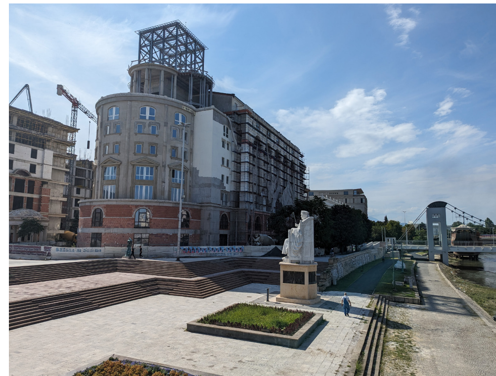
Figure 11. The same vista, looking west from the Stone Bridge, 2023. Most of the open spaces have been destroyed and replaced by buildings from the neoliberal project of the 2010s.

En Skopje 65 vemos un ejemplo preneoliberal de un proyecto de reconstrucción de desastres ejecutado y con ayuda internacional a gran escala. Un esfuerzo y una implicación sin precedentes de las Naciones Unidas y otras agencias en la arquitectura y la planificación como método directo de ayuda y desarrollo comunitario. Skopje 65 también coincide con la transformación de la ayuda humanitaria, pasando de la ayuda directa (método solidario) a incentivos financiarizados que incorporan la vivienda