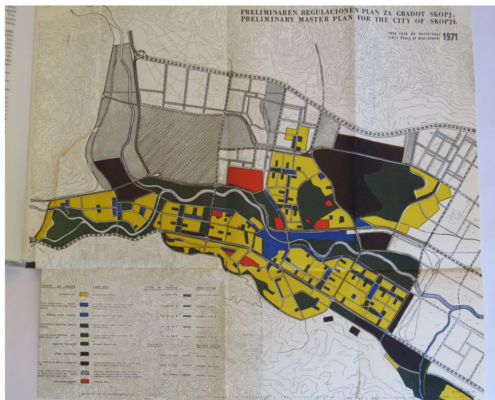
Figures 2, 3, 4. Clockwise: 2, 3: Diagrams explaining the residential or neighborhood units centered on greenery. and: 4 - "Preliminary Master Plan for the City of Skopje" after the first phase was to be finished in 1971, showing how the neighborhood unit expanded to form the newly proposed city. Image from UPP. ZUAS Skopje. 1965.