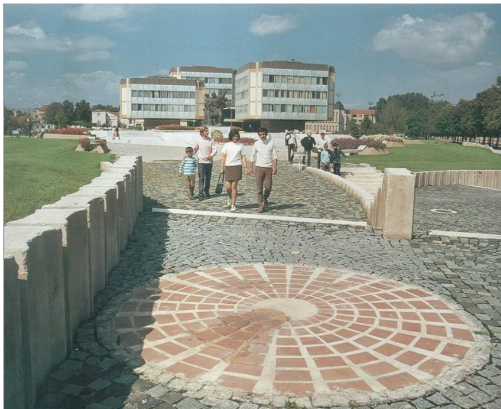
Figure 8. The open space in front of the government building (CK) circa 1970.