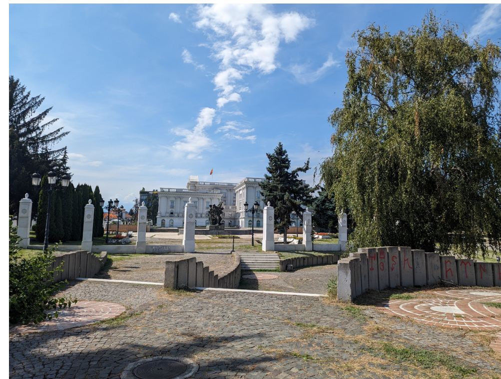
Figure 9. The CK (government) building, in 2023 with its neobaroque facade, after the neoliberal Skopje 2014 redressing of the buildings in the center of the city. The fence posts were part of the project which intended to enclose the entire open space. The fences were taken down after numerous protests and change of government in 2017.

Fig. 5-6.] Los espacios abiertos proporcionaron una plataforma de distancia para examinar la ciudad del espacio construido, edificado y cementado como una topología distinta del espacio abierto. La ciudad con su arquitectura forma un río de construcción que se puede observar desde los espacios abiertos, que actúan como islas temporales, rocas resbaladizas de río que se elevan y desvían el agua. El Museo de Arte Contemporáneo, diseñado por el equipo polaco Tigres de Varsovia, y los espacios abiertos alrededor de la Fortaleza Kale son ejemplos importantes de esto. Los espacios abiertos colectivos más grandes en el caso de Skopje se construyeron con grandes acciones de trabajadores y se financiaron mediante bonos municipales y estatales. Algunos ejemplos son el lago recreativo artificial Treska, la zona forestal protegida de Vodno, el parque Gradski y el parque Gazi Baba. Estas áreas verdes protegidas presentan los espacios abiertos más grandes donde no se permitió un mayor desarrollo en la UPP. En el caso de Skopje, las grandes áreas de recreación, reservas naturales y sitios históricos, así como espacios abiertos más pequeños a escala de vecindario como zonas deliberadas