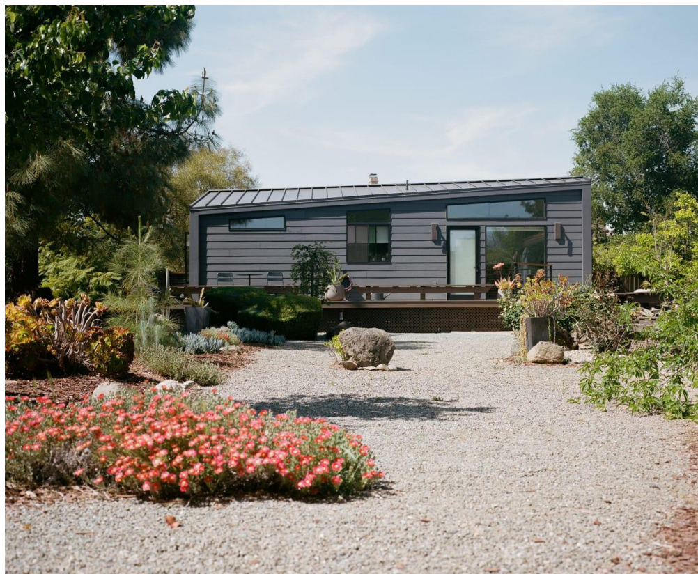
Figure 4. Abodu One pre-fabricated ADU.

now a $4.5 billion market in California,” and technology companies are entirely focused on manufacturing and selling their prefabricated ADUs. The payoff of a pre-designed product and a singularly focused business model is reflected in their significant level of building success: Our two interviewees are responsible for hundreds of ADUs annually in California. One company we interviewed manufactures “one new unit every 6 days,” and sees the traditional architect-led design-bid-build process as both archaic and unacceptably slow. They believe their approach can put “residential architects out of business.” To paraphrase our other tech-respondent, they have capitalized on the fact that “ADUs present a significant and underserved market... Big developers won't bite, and small ones don't have the capacity.”