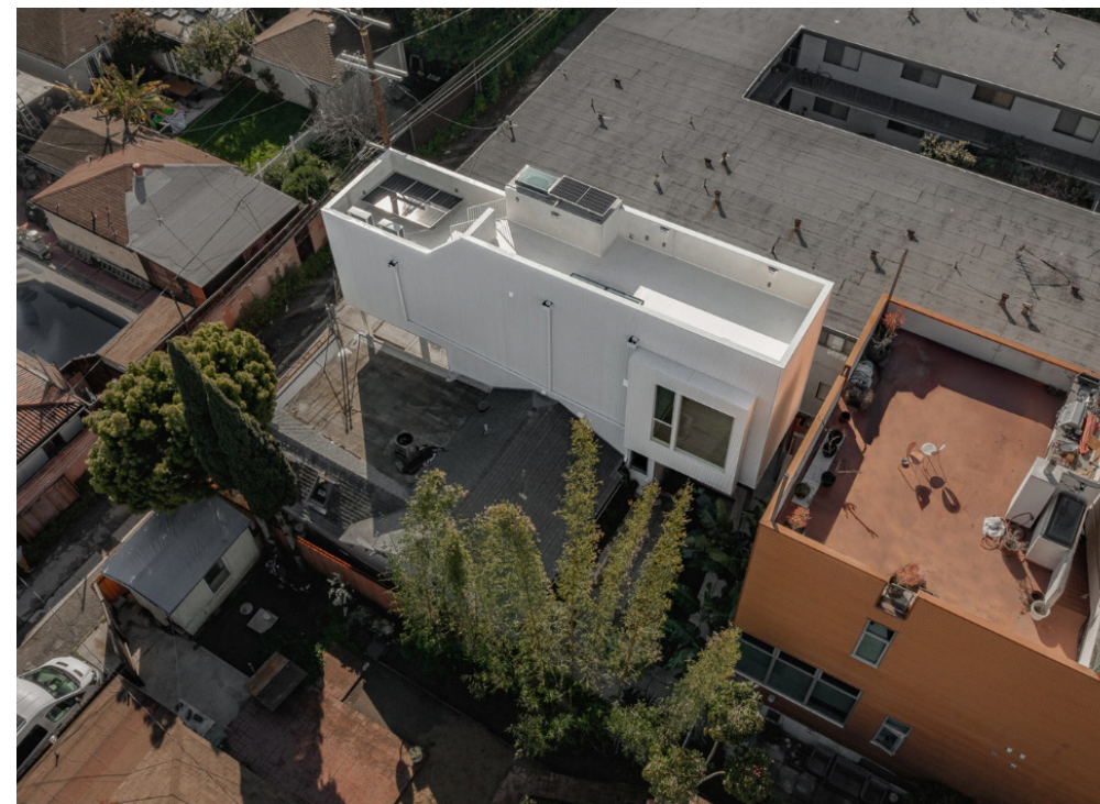
Figure 3. “Infill” ADU designed by Sharif-Lynch Architecture. Image courtesy of Sharif-Lynch Architecture. Image credits: Steve King Architectural Imaging.

Ahora que la ley ha estado vigente durante seis años, se puede evaluar su eficacia, y la investigación de