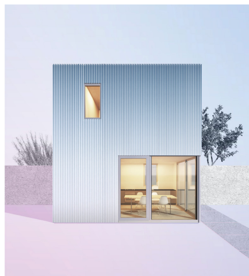
Figura 5. Unidad de vivienda accesoria (ADU) IT House (derecha) y componentes estructurales (izquierda) diseñado por Taalman Architects.

Secondly, ADUs have the potential to contribute to more open cities through new modes of production and labor practices. Our research suggests that architects, contractors, and technology companies see ADUs differently; that there is significant interest in building ADUs, but few inquiries turn into finished buildings; and that architects must learn from