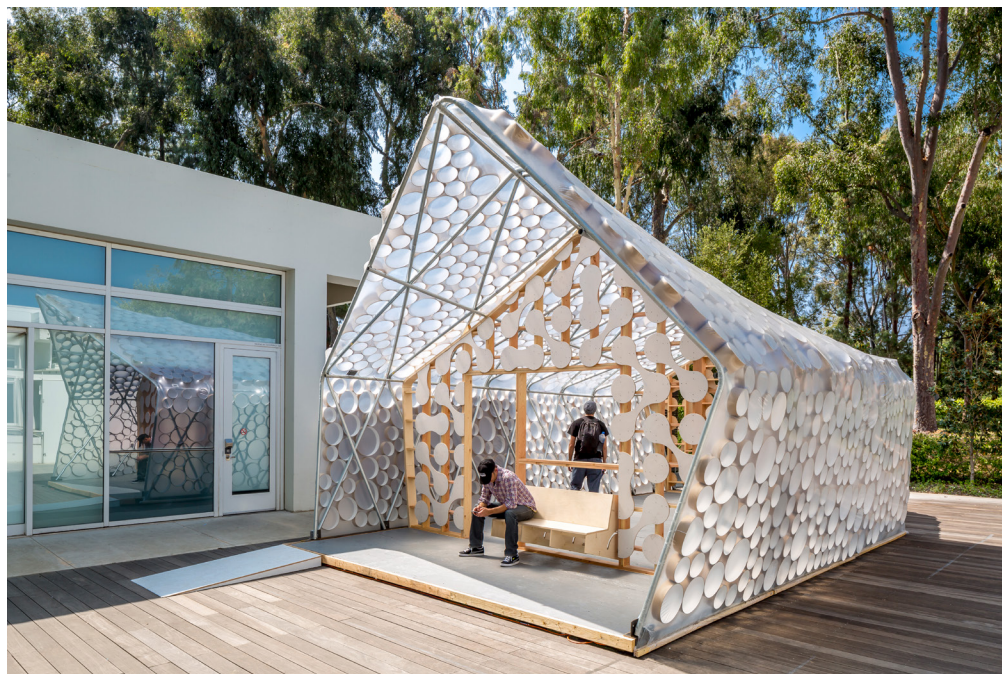
Figure 1. BI(h)OME ADU designed by Kevin Daly Architects. Concept by Dr. Dana Cuff.