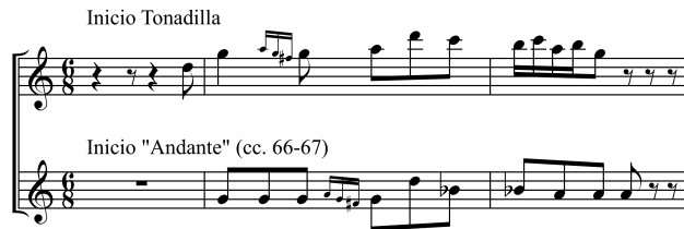
Ejemplo 1: Comparación inicio tonadilla con inicio del Andante en Sol menor, cc.66-67

La introducción, sin embargo, no continúa con un cierre para el aria del militar, sino que regresamos al 6/8, pero ahora en la voz de la pastorcita, y en el modo menor. Además, al ser sol menor y no mi menor, el traslado no ha sido a la relativa, sino que a un más dramático cambio de modo sobre la misma tonalidad que antes proclamaba la alegría de la independencia. Esta otra cara de la moneda es un aria, “Andante”, que ya en sus primeras notas explicita la conexión con el comienzo de la obra, reforzando una inversión de aquel espíritu patriótico: