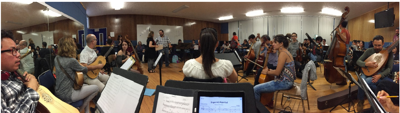
Ensayo en la Facultad de Música de la UNAM el 28 de junio 2017.

El resultado con certeza fue deslumbrante. La presentación casi sinfónica de la 'orquesta' fue muy distinta de las representaciones usuales de estas piezas, que cuentan, comúnmente, con pocos músicos, como los demuestran los ejemplos de los conciertos de Bona Fe o Prosodia. Pero el entusiasmo y la motivación de los participantes, estudiantes o maestros, fue la prueba de que un evento de este género era muy esperado y que correspondía a una voluntad muy fuerte de unirse alrededor de este repertorio específico.