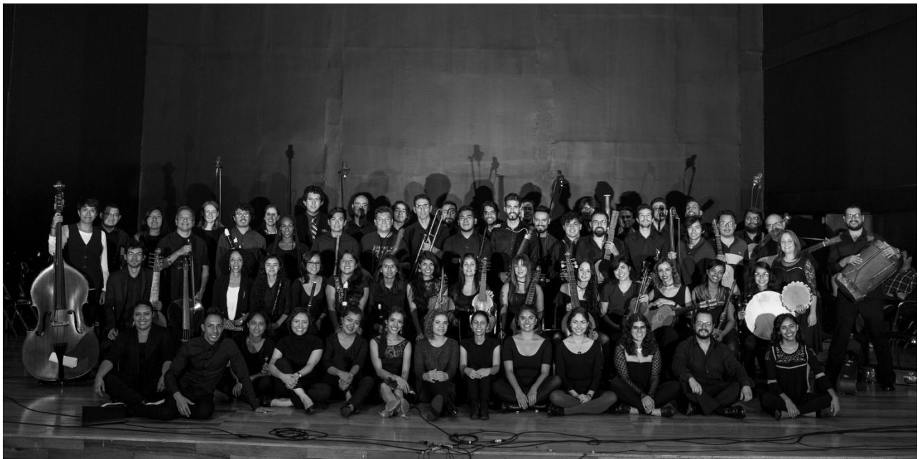
Último concierto al fin de talleres, 30 de Junio 2017. Sala Xochipilli de la Facultad de Música de la UNAM, CDMX.