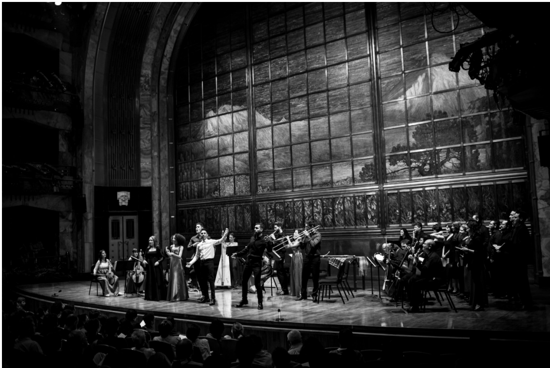
Magno concierto, domingo 2 de julio. Palacio de Bellas Artes de la Ciudad de México.

agrupaciones juntas para el concierto final, que no dejó de ser un éxito de gran calidad interpretativa. No obstante, no dejaba de notarse el incongruencia de un espacio algo desproporcionado para este tipo de música. Simultáneamente, puede haber sido este concierto un modo de abrir posibilidades a conjuntos de Música Antigua para que empiecen a aprovechar lugares hasta la hora reservados solo a otros estilos musicales. También contribuyó a redefinir una estética que no fuera restringida por normas establecidas en el ámbito interpretativo norte-europeo. De todos modos, parecía bastante claro, por las conversaciones informales entre los participantes, que quizás esta sala en particular no hubiera sido la primera elección de todos los músicos, a pesar de la fascinación que provoca el tocar en un lugar tan grandioso y simbólico.