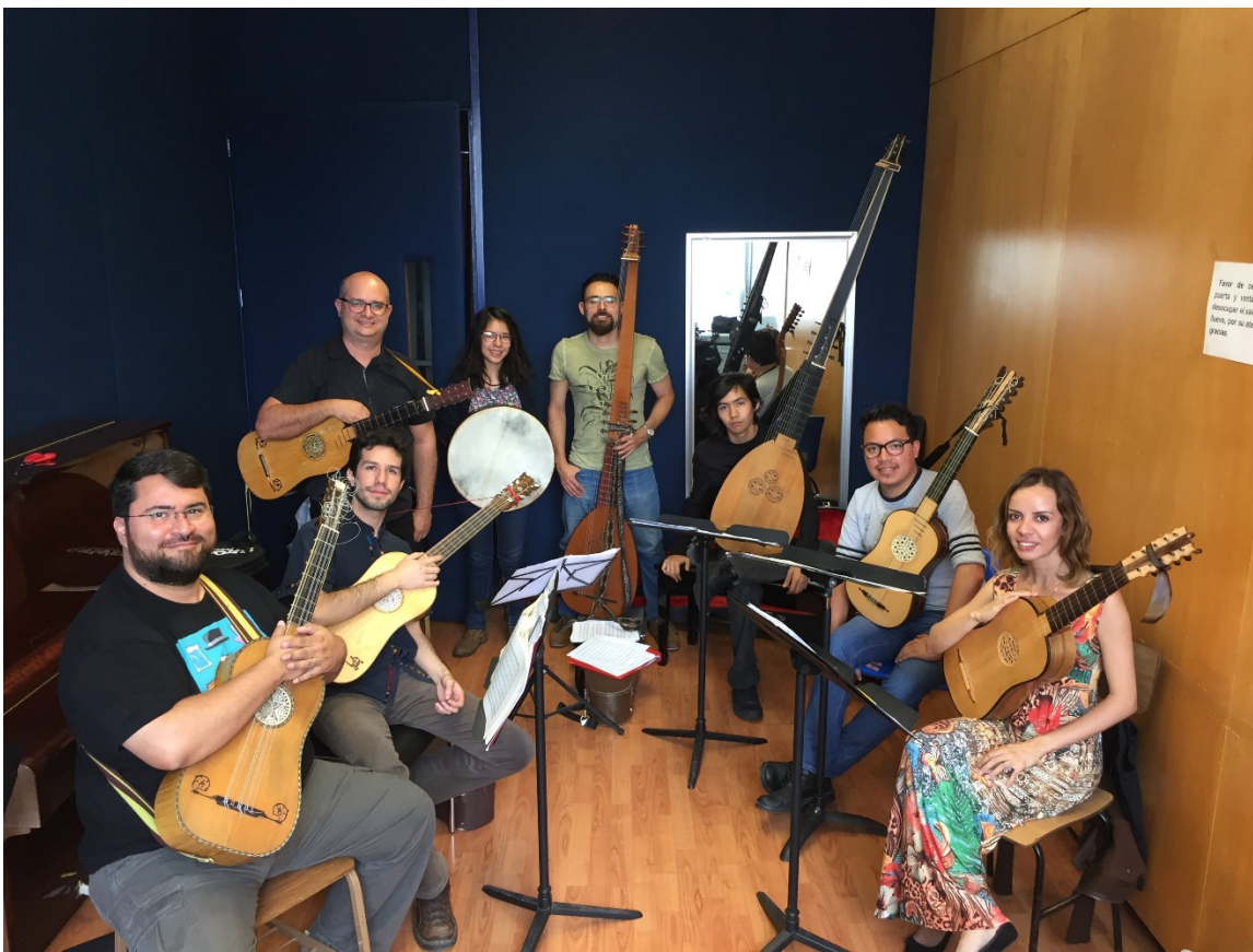
Ensamble de cuerdas pulsada en los talleres.

En el proceso de consolidación de las comunidades regionales entre Cuba, Guatemala y México, los talleres y conciertos del verano 2017 ha tenido también el efecto de empoderar esta comunidad como autónoma y más independiente de los centros culturales europeos o norteamericanos. Si el lado 'filológico' de la interpretación estrictamente informada fue 'corrompida' por el excesivo éxito que tuvo el proyecto — como fue comentado en voz baja durante los talleres — no dejó de tener un papel importante en el desarrollo de una conciencia colectiva más fuerte, con una agencia propia y una ruptura en la etapa educacional llevada a cabo por instituciones eurocéntricas. De esta manera, estos hechos contribuyen a una emancipación geográfica y a la consolidación de una identidad local, basada en una historia cultural común. 45 La publicación del catálogo de la CSG también se posiciona como “más vinculada al movimiento internacional de la investigación sobre música histórica y más cercana a los trabajos de catalogación y documentación que se realizan en ámbitos diversos de la comunidad iberoamericana”. 46