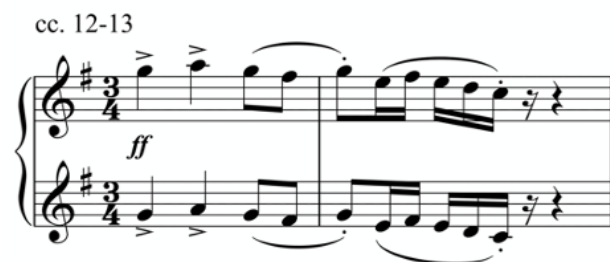
Ejemplo musical: Fragmento de la Danza nº 7 «Valenciana» (cc.12–13). Elaboración propia.

En primer lugar, al escuchar la melodía principal se intuye una copla con intermitencias, como entrecortada. Su disposición a distancia de octava, junto la dinámica en ff y la pausa que le precede, refuerzan la sensación de interrupción del discurso. Las ornamentaciones melismáticas al final de las frases recuerdan a los denominados requints que realiza la voz en el cant d'estil .