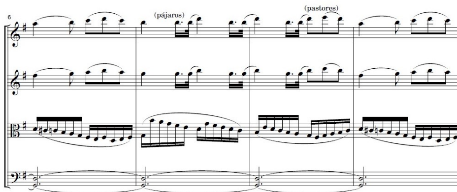
Ilustración 5: Extracto del Cuarteto nº3 de Juan Crisóstomo de Arriaga.

además de hacerle interpretar hasta cinco posiciones. Los momentos de protagonismo para el instrumento en cuestión aumentan desmesuradamente y se le asignan pasajes de responsabilidad en infinidad de ocasiones. Algunos ejemplos pueden verse durante el primer movimiento del Cuarteto nº 1 de la serie (Ilustración 5), 37 o del segundo movimiento del Cuarteto nº 3 (Ilustración 6). 38