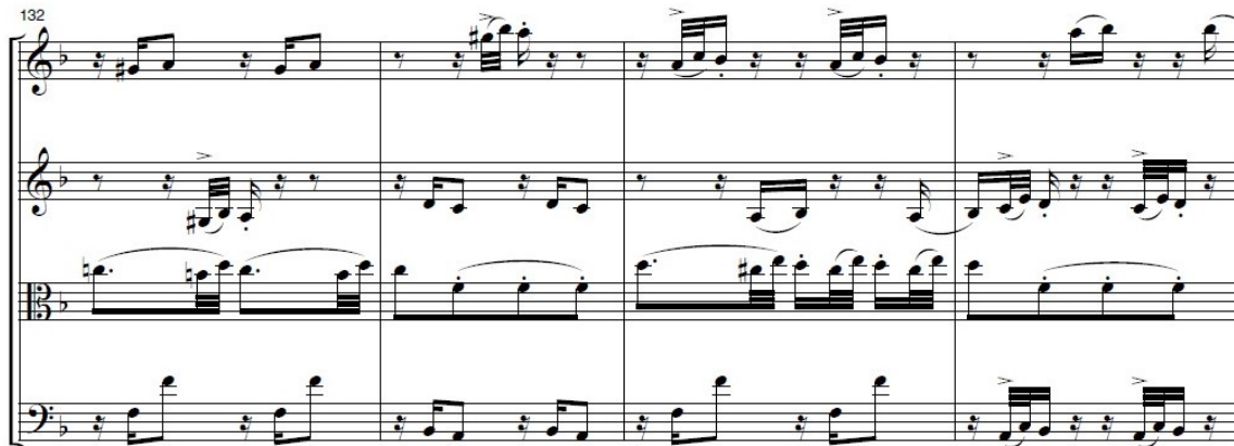
Ilustración 10: Extracto de la coda del Tema variado de Juan Crisóstomo de Arriaga.

El resto de la coda se trata de un pasaje de acertado balance de voces donde la viola es tratada como una más, con una exigencia técnica similar y una participación igualitaria.