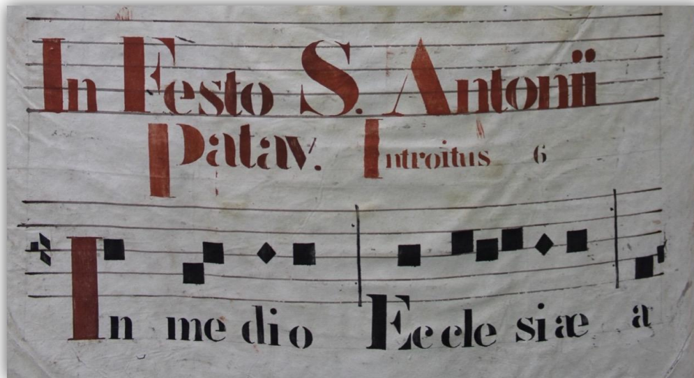
Figura 9. Introito parcial de la Misa de San Antonio de Padua.