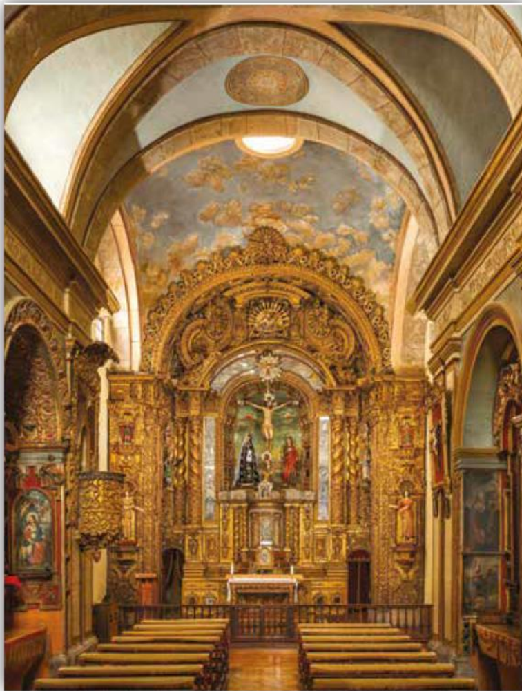
Figura 2. Interior de la capilla de Cantuña.

Por su parte, la descripción realizada por José Gabriel Navarro indica que, para el primer cuarto del siglo XX, la capilla tenía “ocho altares (antes tenía nueve), un coro y una sacristía”. El coro se encontraba contiguo al lugar donde antiguamente era el altar de San Miguel Arcángel, que fue removido para mejorar el acceso y estaba adornado con “un antiguo jubé de madera y un Cristo crucificado al medio” (Navarro 1925, vol. 1, 128).