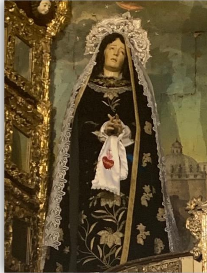
Figura 5. Virgen de los Dolores de Cantuña.