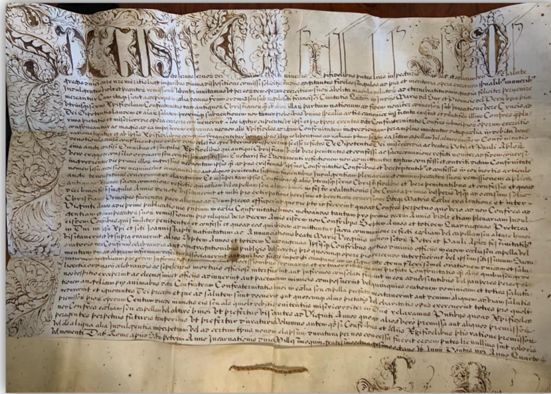
Figura 4. Bula auténtica de fundación expedida por Sixto V.

No obstante, un documento da fe del funcionamiento de esta cofradía varios años antes en el convento franciscano, pues don Garcí Sánchez de Carvajal, vecino de la ciudad, presentó el 4 de agosto de 1556 las