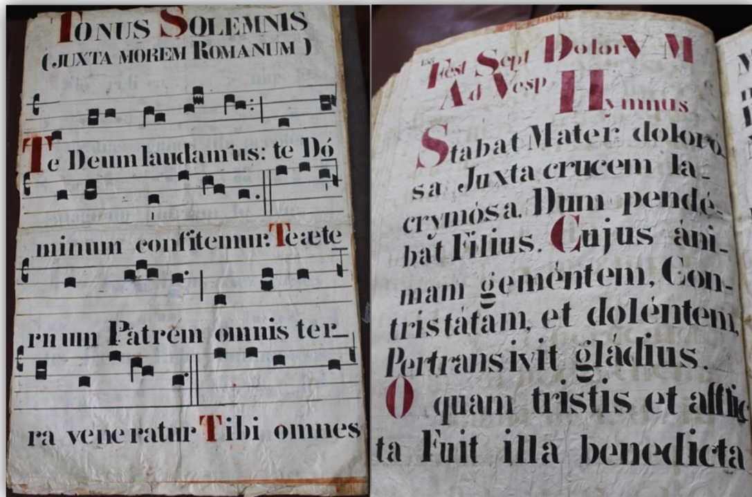
Figura 7. Te Deum y texto parcial del Stabat Mater dolorosa . Fuentes: EC-BSF5, f. 11v y EC-P4BSF32, f. 79v.

Todo lo contrario ocurre con la festividad de las Llagas o Estigmas de San Francisco, donde seis códices atestiguan la música y el texto pertinente (ver Tabla 2) 55 . Además, la documentación de archivo también puntualiza que en esta ocasión litúrgica se oficiaba una misa cantada 56 . Dicha misa corresponde a la copiada en los códices EC-BSF5 (ff. 49v-51r) y EC-P10BSF33 (ff. 85r-87v), cuyo inicio se expone en la Figura 8. El hallar por duplicado estos cantos explica, claramente, que al menos un ejemplar servía para uso del Convento Máximo y otro para la capilla de Cantuña.