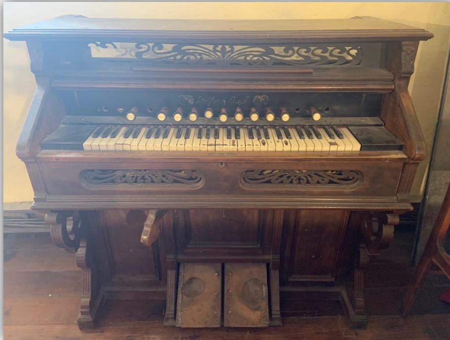
Figura 6. Armonio de fuelles y pedales (s. XIX ex.) en el coro de la capilla de Cantuña.

gestionó la adquisición de un nuevo armonio proveniente de Alemania a cargo del señor “Alberto Herman [sic]” 45 , que costó 550 sucres.