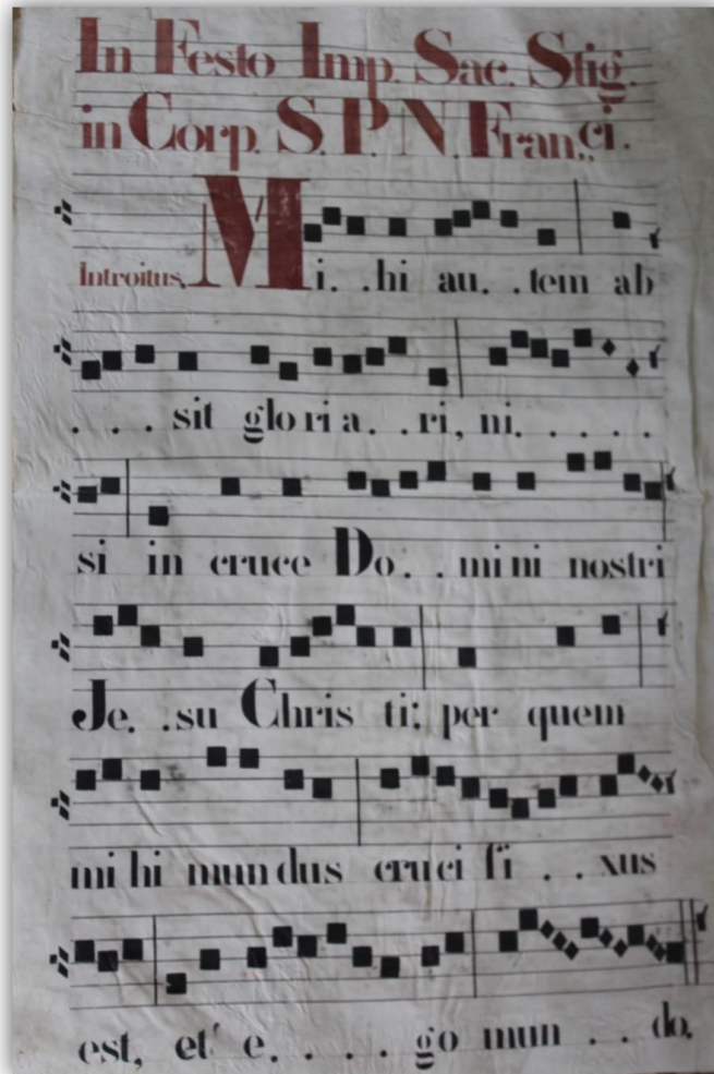
Figura 8. Introito parcial de la Misa de la Impresión de las Llagas de San Francisco.