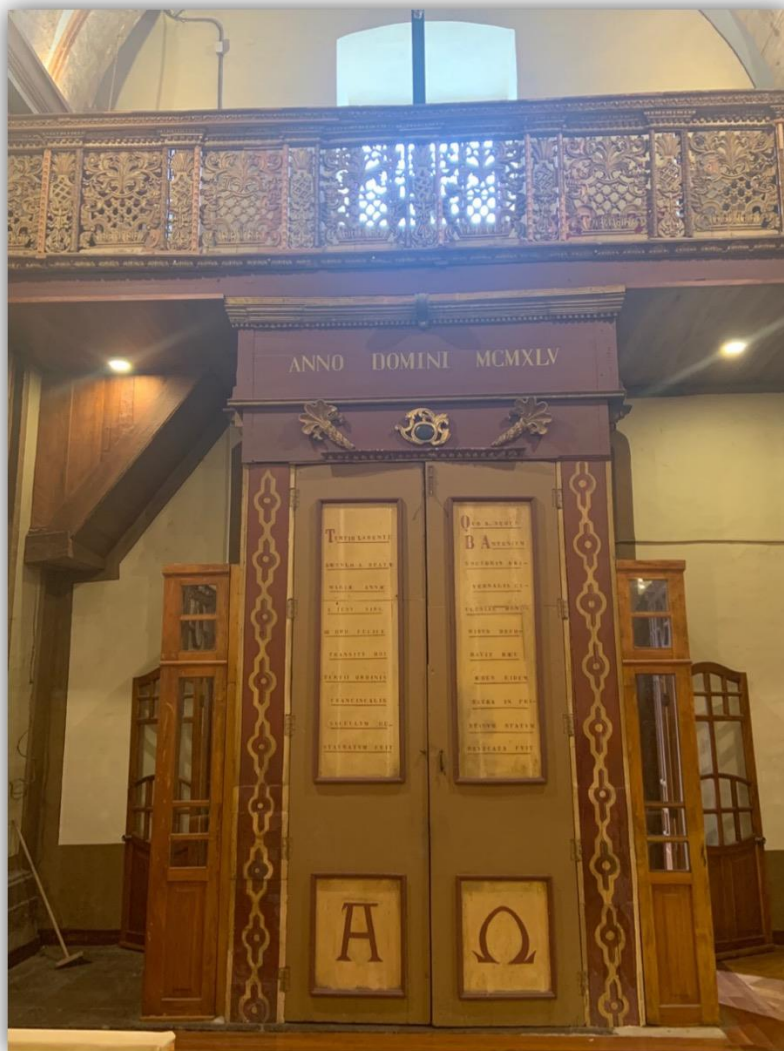
Figura 3. Coro de la capilla de Cantuña.