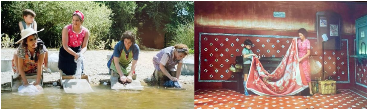
Figura 1. Salvador, su madre y sus amigas lavando la ropa. Fuente: Dolor y gloria , Dir. Pedro Almodóvar, 2019

Así, este dinamismo de madre e hijo se plasma de forma explícita en los primeros minutos de Dolor y gloria . En este filme se proyecta la vida de un cineasta en deterioro físico en la España contemporánea en la que su protagonista recuerda su infancia bajo la dictadura franquista de los años sesenta. En el contexto de un proyecto cinematográfico autobiográfico, la película presenta a su protagonista, Salvador, durante su infancia y juventud junto con su madre, Jacinta. 1