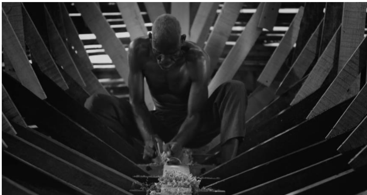
Imagen 2. Turco en el vientre del barco.