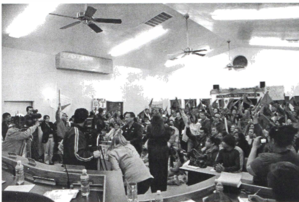
Foto 1. Miembros del campito se manifiestan en el Palacio Municipal de Wasco, CA el 11 de enero del 2007 para exigir su derecho a la vivienda ante el Concejo de la Ciudad.

para pedirles a los miembros de la Mesa Directiva de la Autoridad de Vivienda que parara esta disposición inhumana. La junta estaba repleta de niños, adolescentes, madres, abuelitos y hombres que llevaban banderas de Estados Unidos y México, acompañados de pancartas expresando: Somos Seres Humanos con Derechos, Pedimos una Solución Justa, Los Niños Tienen Derechos y Esperamos que el Comisionado de la Autoridad de Vivienda Hagan Conciencia y Tengan Compasión de No Echar a la Calle a las Familias. La Foto 1 es una imagen de la junta.