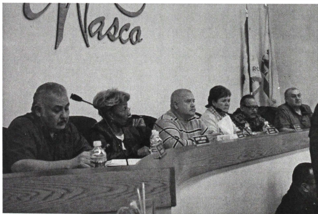
Foto 2. Miembros de la Mesa Directiva de la Autoridad de Vivienda escuchan atentamente a la gente del “campito”

En el mes de julio del año 2006, por iniciativa de uno de los representantes del Concejo de la Ciudad, sometió a votación renovar la Mesa Directiva de la Autoridad de Vivienda compuesto por: cinco habitantes de Wasco, un representante de las viviendas a cargo del Housing and Urban Development (HUD) , y un representante de las viviendas a cargo del USDA . Todos