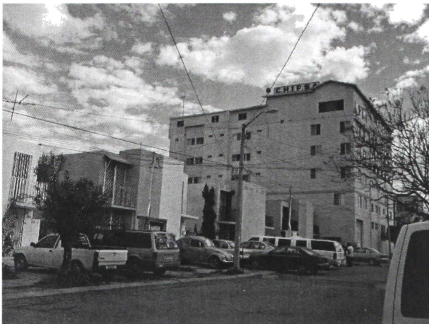
Foto 3. Hospital en Playas de Tijuana