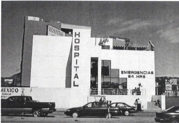
Foto 2. Hospital en la zona del cruce fronterizo de Tijuana

Estas primeras dos zonas están relativamente próximas al cruce fronterizo de la zona del Río Tijuana (el puerto de ingreso mas antiguo de la ciudad y el de mayor uso). Esta ubicación les da la ventaja de accesibilidad, tanto para peatones como para vehículos.