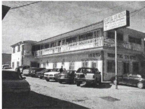
Foto 4. Hotel convertido en hospital