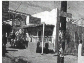
Foto 5. Antigua casa-habitación convertida en clínica

Si bien es cierto que algunos de estos problemas son el resultado de no cumplir con los reglamentos locales, específicamente con el reglamento de construcciones que regula el número de cajones de estacionamiento, las servidumbres frontales, laterales y posteriores, así como los coeficientes de uso y ocupación del suelo, las autoridades encargadas de la planeación urbana poca o nula atención han prestado a esta situación, por lo que determinados sectores de la ciudad cuyos usos iniciales eran destinados predominantemente a vivienda, se han venido transformando en zonas de consultorios y clínicas que funcionan en antiguas casas habitación, con todas las limitaciones de infraestructura que esto conlleva. La Foto 5 muestra una de estas.